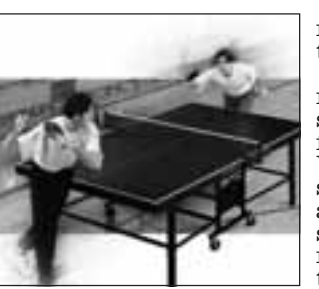
Il tavolo da tennis.

DOPO la pausa per le festività natalizie, riprendono sabato e domenica per tutti gli appassionati prossimi i Campionati a squadre di tennistavolo.